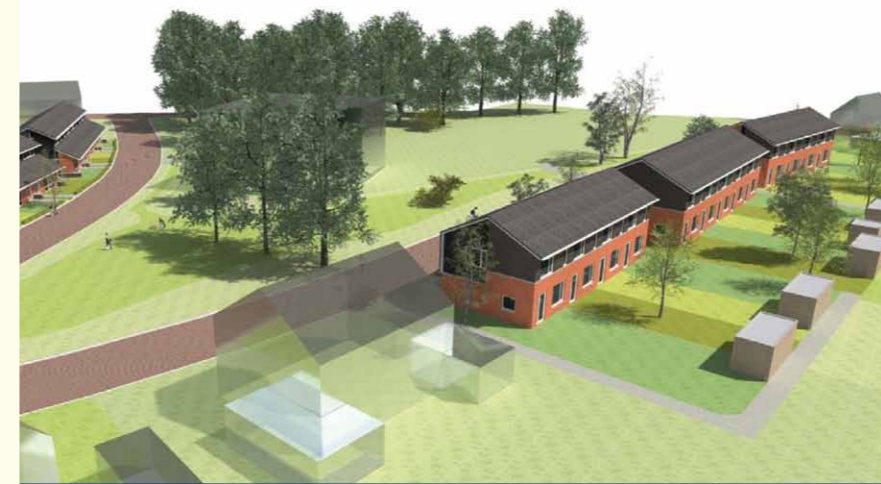
De twee blokken van vier koopwoningen met in het midden en er tegenover de huurwoningen die Woningstichting Bergh ook bouwt.

Energiezuinig, comfortabel en karakteristiek. Dat zijn de kenmerken van de acht koopwoningen die Woningstichting Bergh aan de Steegseweg in Beek laat bouwen. De nieuwbouw, uitgevoerd in een eigentijdse landelijke stijl, is bedoeld voor starters op de woningmarkt.