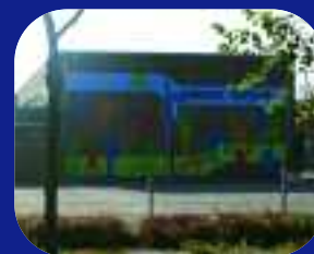
Superhelden in onze wijk