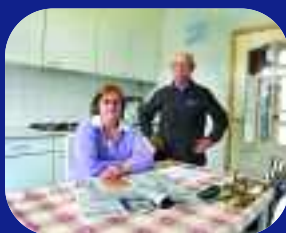
Verhuizen bij sloop