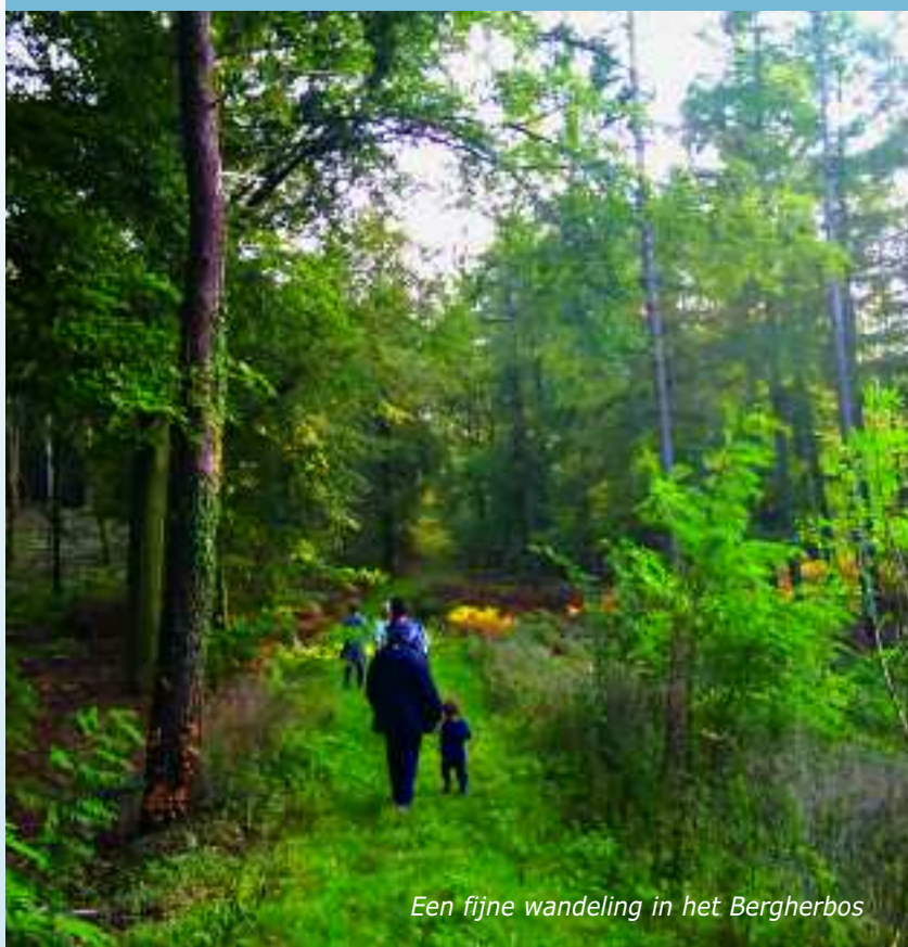
Een fijne wandeling in het Bergherbos

De zomer is voorbij. Hij was kort en krachtig en begon heel vroeg. Tijdens de zomervakantie was er helaas nog maar weinig van over. We kijken al weer uit naar de herfst. Daarom vindt u in dit blad weer een paar leuke knutseltips voor de kinderen en andere leuke suggesties om de herfst door te komen. Straks als de bladeren weer van de bomen vallen, denkt u dan ook aan uw dakgoot? Als u lid bent van het Servicepakket kunt u de dakgoot door ons schoon laten maken. Meer informatie hierover vindt u op pagina 4 en 9.