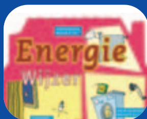
Energie besparen is geld besparen!