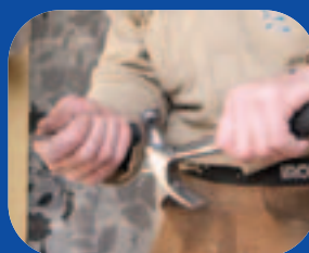
Het servicepakket huurdersonderhoud