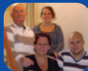
Ode aan de oudheid