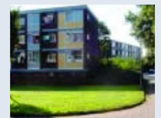
Hoe werkt het optiemodel?