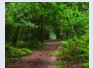
Zorgen over klimaat- verandering