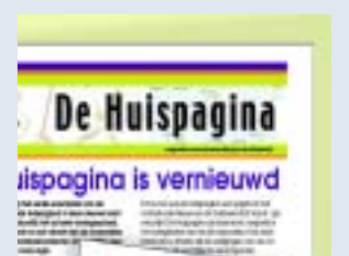
Regionale woningaanbod op Huispagina